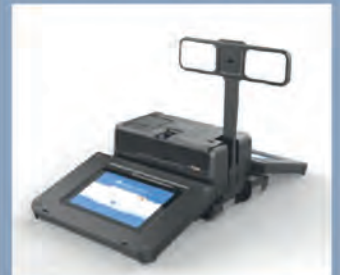
Мобильный комплекс сбора данных EMP 2901.