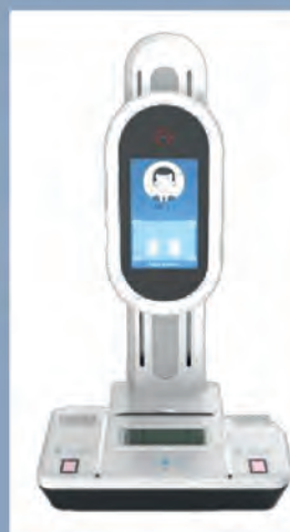
Настольный терминал для сбора биометрических данных EMP 2950.

Обращаться за ID-картой следует в территориальные подразделения по гражданству и миграции. Процедура займет около 10 минут. Настольный терминал для сбора биометрических данных сфотографирует клиента, снимет отпечатки указательных пальцев и «попросит» расписаться на специальном планшете. Аппарат способен автоматически регулировать позицию камеры по росту заявителя, проследить, чтобы у него были открыты глаза, посоветовать придвинуться или отстраниться, чтобы фотоизображение соответствовало общепринятым международным правилам. Заполнять анкету вручную, сверяясь с каждой буквой латинской транскрипции, не нужно: информация перенесется из имеющихся учетов.