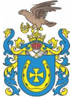
Герб роду Абрамовічаў

На вершы Яна Баршчэўскага кампазітар напісаў раманы "Дзеванька", "Гарэліца", "Дуда". Упершыню тыя вершы былі надрукаваны ў 1843 годзе ў часопісе "Rocznik literacki" на беларускай мове. Увогуле ж Антон Абрамовіч быў цесна звязаны з гуртком Яна Баршчэўскага. Асаблівае значэнне надаваў вывучэнню народнай творчасці, цаніў у фальклору першародную прыгажосць. І хто ведае, можа менавіта фальклорна-