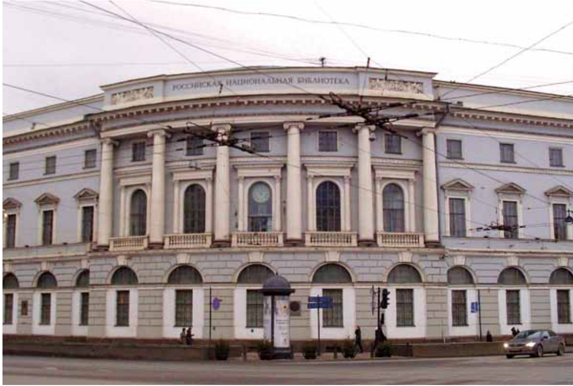
Будынак Расійскай Нацыянальнай бібліятэкі ў Санкт-Пецярбурзе

замужжы Малейскай). У сваім доме яна прымала многіх знакамітых кампазітараў і выканаўцаў — выхадцаў з зямель даўняй Рэчы Паспалітай. Дапамагала ім ладзіць канцэрты. Часта інфармавала Адама і Цэліну Міцкевічаў, якія ў той час жылі ў Парыжы, пра музычнае жыццё, дасылала ім новыя нотныя выданні, нават запрашэнні разам з канцэртнымі праграмамі. У ліставанні з сястрою Цэлінай Гэлена часта падымала розныя музычныя праблемы й заўсёды жадала атрымаць новыя звесткі пра слаўтых кампазітараў і выканаўцаў Еўропы. Вось фрагмент ліста Цэліны Міцкевіч ад 19 чэрвеня 1851 г.: "Пытаеш мяне, дарагая Гэлена, ці добра мы ведалі Фрыдэрыка Шапэна, ці не навучаў ён каго-небудзь з нашых дзяцей? Вымушана табе прызнацца, што ніхто з іх не выказвае вялікіх талентаў у музыцы... Папрашу цябе, мая Гэлена, ці не магла бы ты