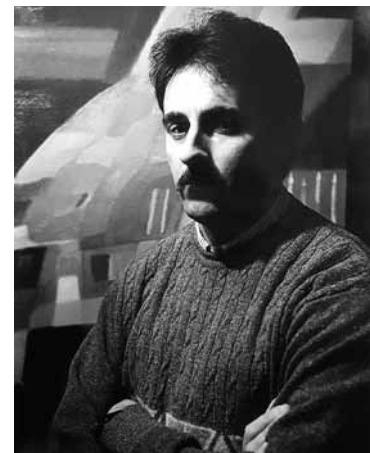
Кампазітар Яўген Паплаўскі

ўзвышанага”. І далей: “Рамантызм ёсць не што іншае, як унутраны свет душы чалавека, патаемнае жыццё ягонага сэрца”. Якраз для эстэтыкі рамантызму характэрна ўзнікненне гістарычнага мастацкага мыслення. Згадаем: менавіта ў той час у Еўропе фарміруецца новы кірунак у выяўленчым мастацтве пад назвай voage pittoresque : артыстычныя вандроўкі. Многія мастакі, у тым ліку і ўраджэнцы Беларусі Напалеон Орда і Юзэф Ігнацы Крашэўскі, не абмінулі той плыні, сутнасць якой — занатаванні абліччаў часу праз замалёўкі архітэктуры, дзе ролю эмацыянальнага акампанемента адыгрываў краявід. Увогуле ж рамантычнае перажыванне гісторыі заўсёды аваяна тугою, спараджае думкі пра часоваць усяго жывога.