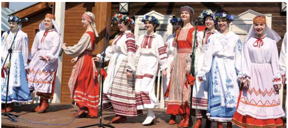
Ансамбль "Купалінка" выступае ў Музейным комплексе "Наследдзе"