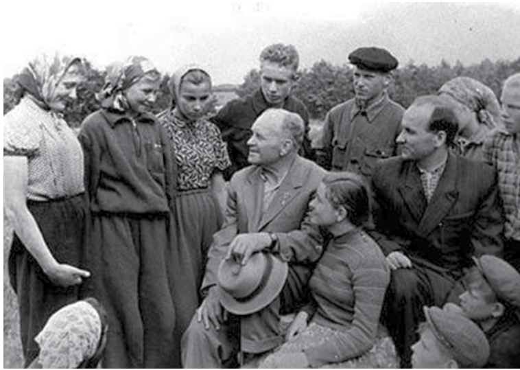
Старшыня-Герой сярод землякоў

Пазней, калі ў Гоцку паставілі цагельны завод (бо гліны ўсялякай прамысловай там, казалі, на сто гадоў хопіць), калі пабудавалі масты, дарогі, то нам, дзецям, была ўжо чым хваліцца перад ровеснікамі з суседніх