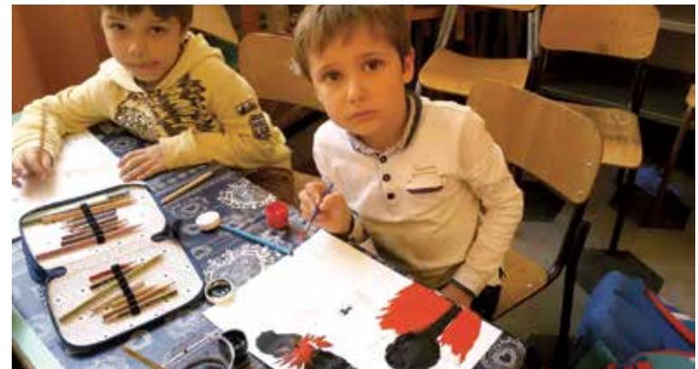
У Італіі дзеці ведаюць пра наступствы аварыі на ЧАЭС

Дарэчы, Ніна Ігараўна прачытала і свой верш, прысвечаны Чарнобыльскай трагедыі. Ёсць у ім такія радкі: “Аварыя! И Беларусь мою / Ты черными крылами вдруг задела./