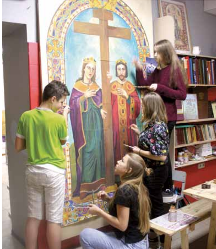
Юныя мастакі з “Абразка” працуюць над эскізам пано