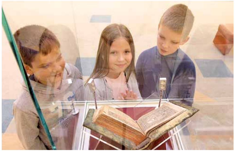
Кожнай кнізе — свой час

гэтых тэкстаў (іх можна пабачыць у факсімільна дэпрачытаць у перакладзе на рускую, беларускую і англійскую мовы) аказалася абсалютна арыгінальным. Прадмовы Скарыны ў перакладзе на сучасную беларускую мову раней не выходзілі. Алесь Бразгуноў папрацаваў выдатна як перакладчык, захаваўшы стылістыку, дакладна перадаўшы мову аўтара. Вельмі добра, што слова Скарыны будзе цяпер даступным і зразумелым для шырокай аўдыторыі.