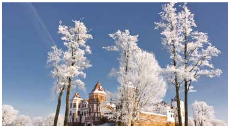
Зімовыя карункі ля Мірскага замка

Па-першае, Беларусь — гэта краіна з багатай гісторыяй. А ці ведаеце вы, што цяпер на яе тэрыторыі можна пабачыць ажно тры гістарычныя сталіцы: Полацк-Полацк (сталіца Полацкага княства), Наваград-Наваград (сталіца Вялікага