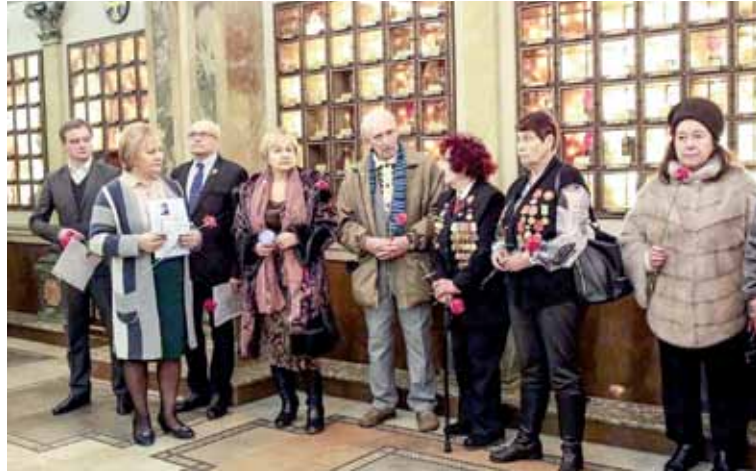
Беларусы з Санкт-Пецярбурга памятаюць пра подзвіг Героя

У цырымоніях узяцця зямлі з магілы Героя ў Піцеры, закладкі капсулы паўдзельнічалі школьнікі, ветэраны, курсанты, актывісты фонду “Белыя Росы” і розных беларускіх нацыянальна-культурных аўтаномій Расіі. Былі таксама дэлегацыі з