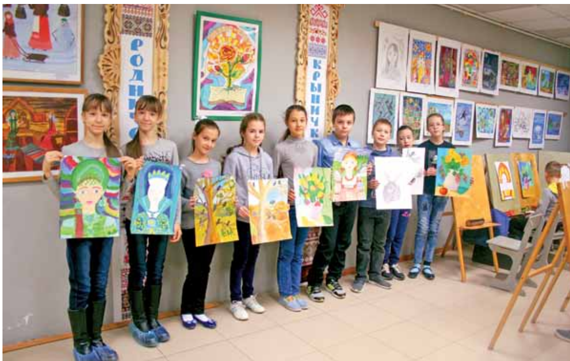
Мастакі з гуртка “Абразок” на занятках у галерэі “Родничок-Крынічка”

Летась у нашай газеце быў змешчаны тэкст Уладзіміра Банцэвіча “Цёплы абярэг традыцый” (ГР, №47, 14.12.2017), з якога вынікае, што ўраджэнец Палесся і цяпер узнавальвае Растовскую рэгіянальную грамадскую суполку “Саюз беларусаў Дону”. Каштоўны плён ягонай з аднадумцамі працы — і музей Славянскай-беларускай традыцыі ды