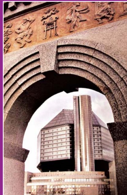
Духовное и интеллектуальное наследие. Национальная библиотека.