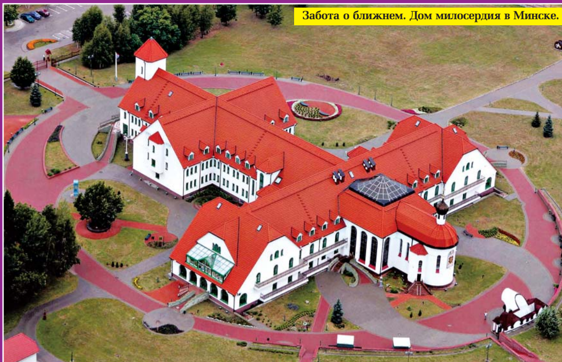
Забота о ближнем. Дом милосердия в Минске.

Все течет. Все изменяется... Древнегреческий философ Гераклит вывел вечную формулу. Безусловно, справедливую и сегодня. Но констатировать изменения — одно, а чувствовать их — иное. В суете дней чего-то не заметил, к чему-то быстро привык. И кажется, что так было всегда. Но у меня в руках наглядный путеводитель по последним полутора десяткам лет. Издательский центр БЕЛТА выпустил двухтомник «Беларусь созидаящая». Более тысячи страниц в иллюстрациях рассказывают о новейшей истории развития нашей страны и ее становлении как государства.