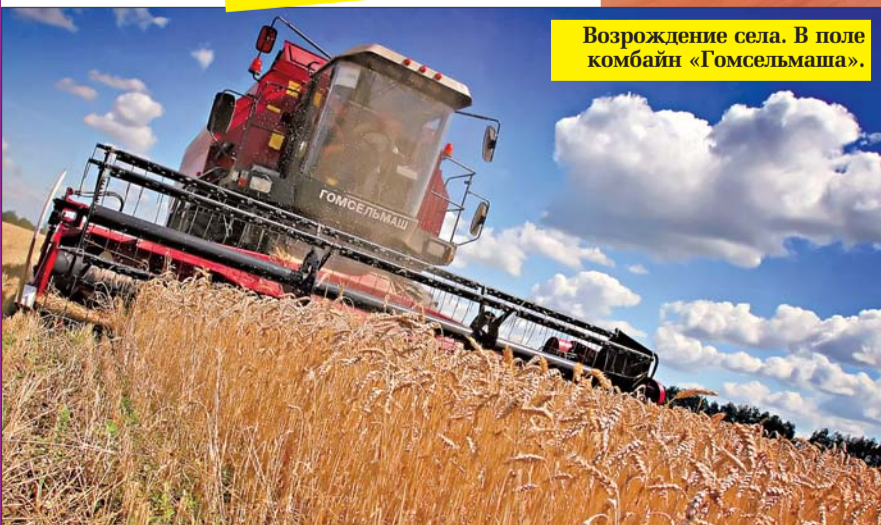
Возрождение села. В поле комбайн «Гомсельмаш».