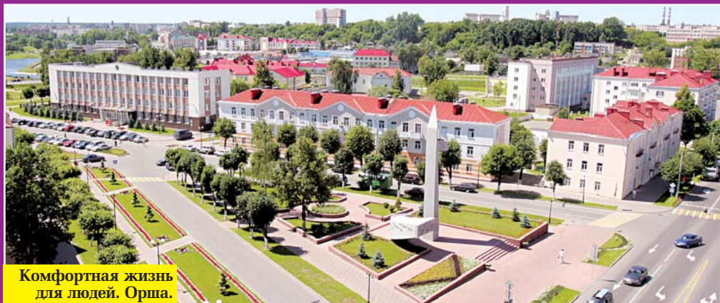
Комфортная жизнь для людей. Орша.