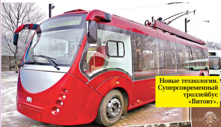
Новые технологии. Суперсовременный троллейбус «Витовт».