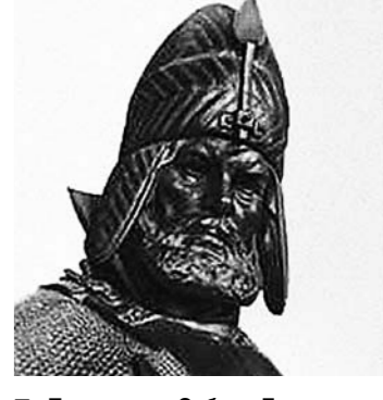
Покоритель Сибири Ермак.

16 марта В 1936 году с конвейера Горьковского автомобильного завода